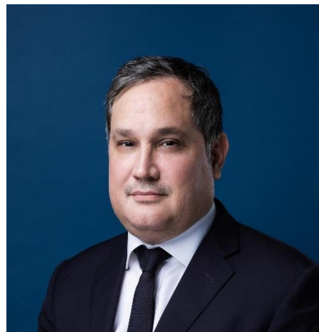
Nagy Márton Nemzetgazdasági Miniszter

A XXI. század harmadik évtizede megváltoztatja a világunkat. Globális válsághelyzetek sora, háborúk és ezekhez kapcsolódó geopolitikai és gazdasági átrendeződés zajlik a világban. Az Európai Unió versenyképessége folyamatosan csökken az Egyesült Államokkal és Kínával szemben, miközben a cél az lenne, hogy a gazdaság zöld és digitális átállásának véghezvitelével Európa legyen az a kontinens, amely olyan gazdasági környezetet teremt, amelyben a legjobb elérhető technológiák állnak rendelkezésre olyan módon, hogy közben a lehető legkevésbé károsítsuk a környezetünket.